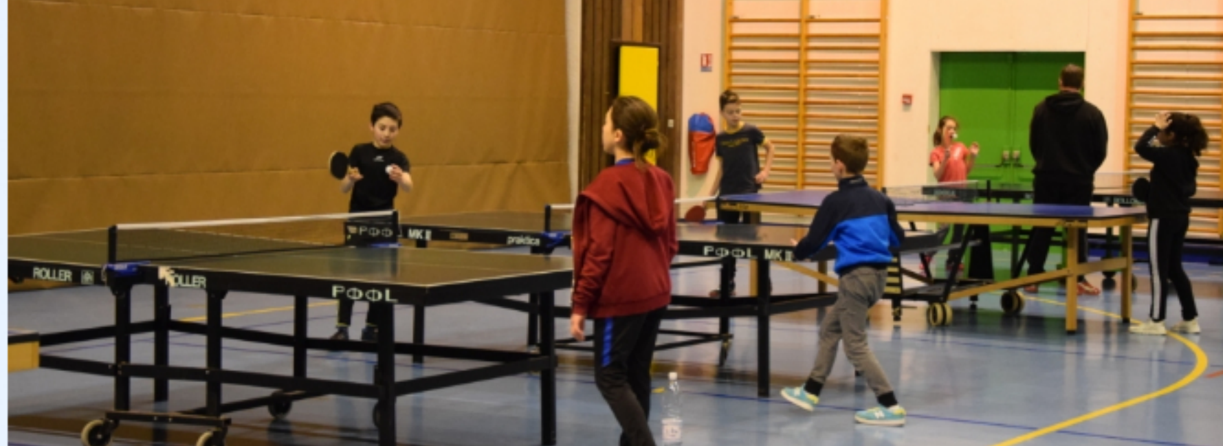
Animations au sportenum

Pour les jeunes, il est obligatoire de monter et démonter les tables à deux.